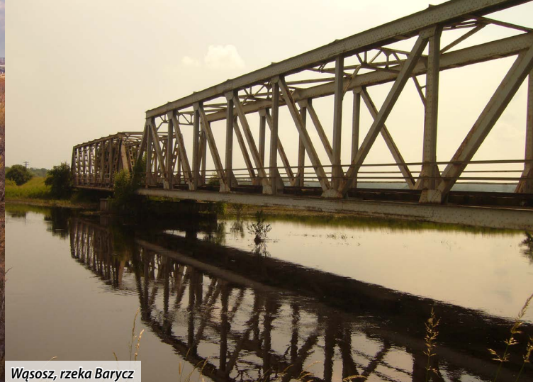
Wąsosz, rzeka Barycz