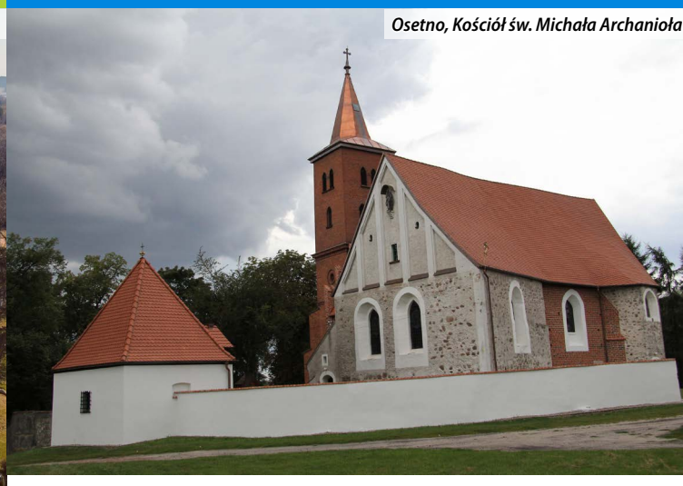
Osetno, Kościół św. Michała Archanioła

LGD Ujście Baryczy to urokliwa część doliny Baryczy i Odry położona na północy Dolnego Śląska. Liczne starorzecza, oczka wodne i wielkie łąki na terasach zalewowych Baryczy i częściowo Odry, na odcinku przyujściowym łączą się w jedną wielką dolinę niezwykle bogatą w unikatowe gatunki flory i fauny, docenianie nie tylko przez koneserów. Można tu napotkać chronionego w krajach Unii Europejskiej motyla modraszka nausitosa i posłuchać koncertu rzadkiego szarańczaka terenów podmokłych – napierśnika. Warto wybrać się w kajakową podróż po obszarze i delektować się pięknym krajobrazem, ciszą, wylaniającymi się wśród lasów i łąk zabytkami w towarzystwie krążących nad nami orłów bielików.