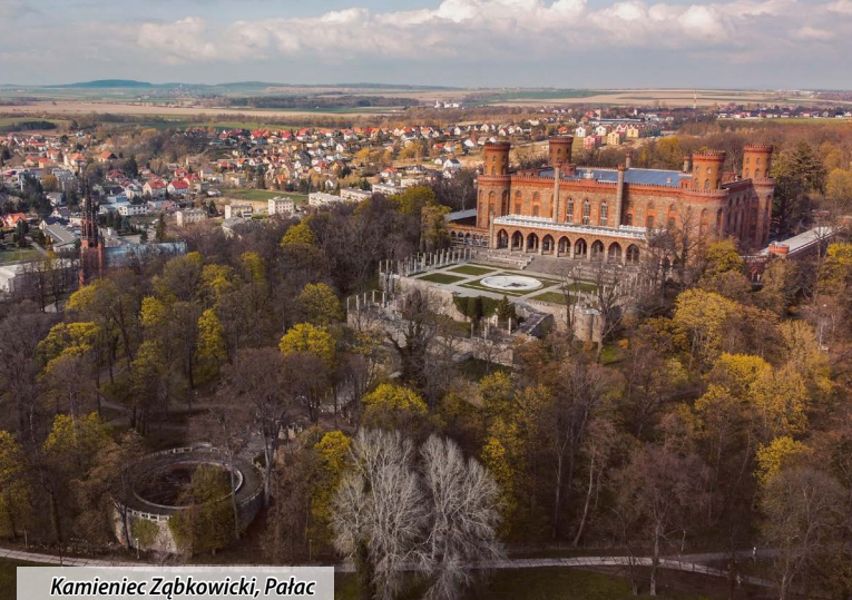
Kamieniec Ząbkowicki, Pałac