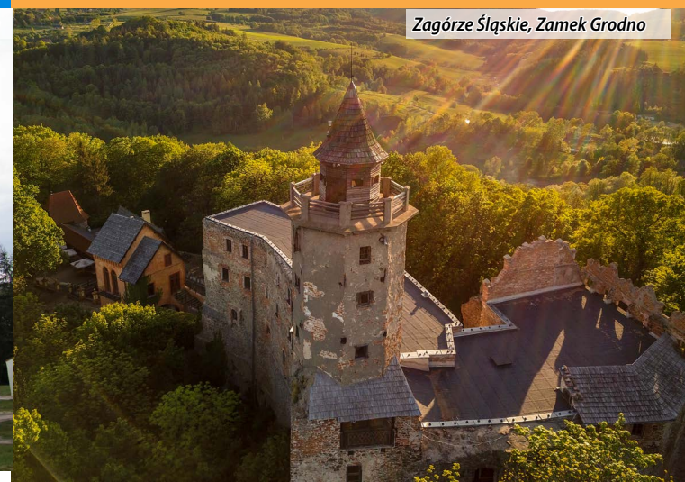
Zagórze Śląskie, Zamek Grodno

Obszar „Partnerstwa Sowiogórskiego” znany jest z wielu urokliwych zakątków oraz atrakcji turystycznych takich jak podziemne miasta, zamki otwarte na zwiedzanie, jak i najstarsze w Polsce ruiny, a także średniowieczne kościoły i pomniki przyrody. Sam krajobraz również przyciąga coraz więcej turystów, a naszych mieszkańców napawa dumą fakt zamieszkiwania w tak pięknej scenerii. Wiemy jak łatwo zakochać się w Górach Sowich i chcieć tu powracać o każdej porze roku, kiedy natura na nowo barwi wspaniałą przyrodę i w całej okazałości pokazuje jej piękno. Góry Sowie to również bogate zaplecze wydarzeń związanych z tradycjami kulinarnymi, imprezami sportowymi (maratony piesze, rajdy rowerowe). Zapraszamy!