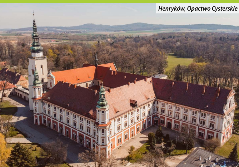
Henryków, Opactwo Cysterskie

Ziemia Ząbkowicka, położona w południowo-wschodniej części województwa dolnośląskiego, pełna nieodkrytych atrakcji, oferująca niezwykle połączenie walorów krajobrazowych z bogactwem świata przyrody. Zachęcamy do aktywnego odkrywania jej uroków – malowniczych szlaków, zagadkowych historii i wyjątkowych zabytków. Warto ją odwiedzić dla łagodnego klimatu, spokoju bukowych lasów, czystości górskich potoków, malowniczych widoków, urokliwych średniowiecznych miasteczek oraz tajemniczych zamków i opactw.